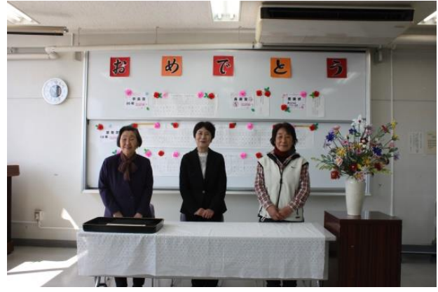
左から、岡田理事長、木村学長、望月学長代行