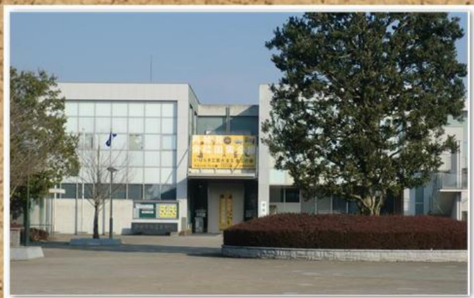
笠間芸術の森公園 陶芸美術館