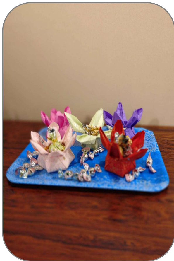
夢の花の器 (四弁・五弁・六弁)

日常生活の身のまわりの何かを作ろうと思い、キャンディーボックスを作りました。色は三色です。チョコや何かいろいろのキャンディーを盛ってみようと思います。