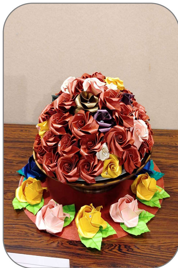
バラのドーム型装花

帝国ホテルのロビーで見た美しいバラの装花に感動し、その姿を折り紙で再現しました。 学園祭で多くの方に見て頂けるのが楽しみです。