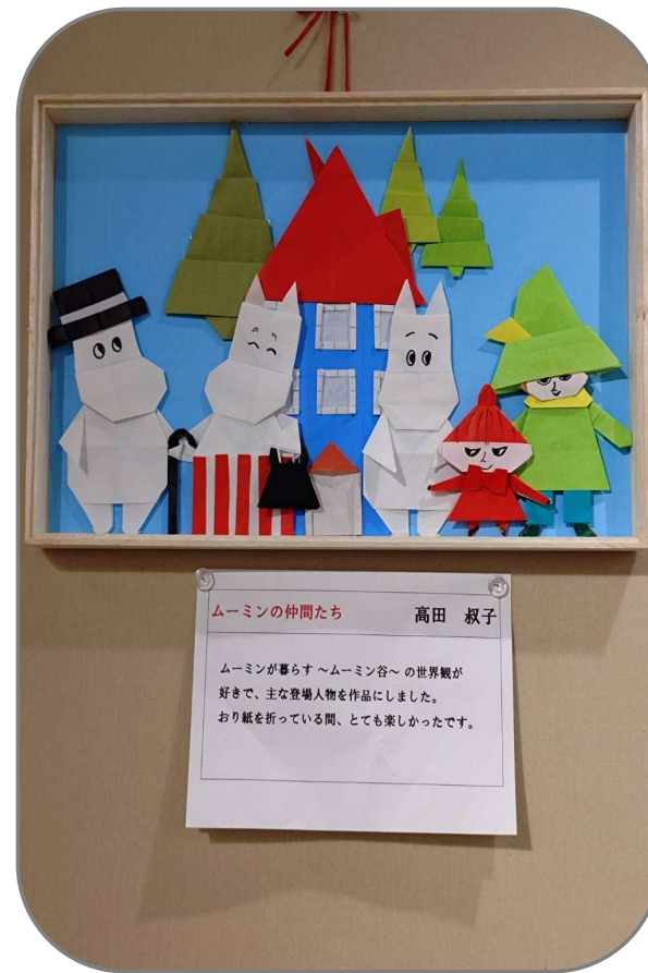
ムーミンの仲間たち

ムーミンが暮らす～ムーミン谷～の世界観が好きで、主な登場人物を作品にしました。 おり紙を折っている間、とても楽しかったです。